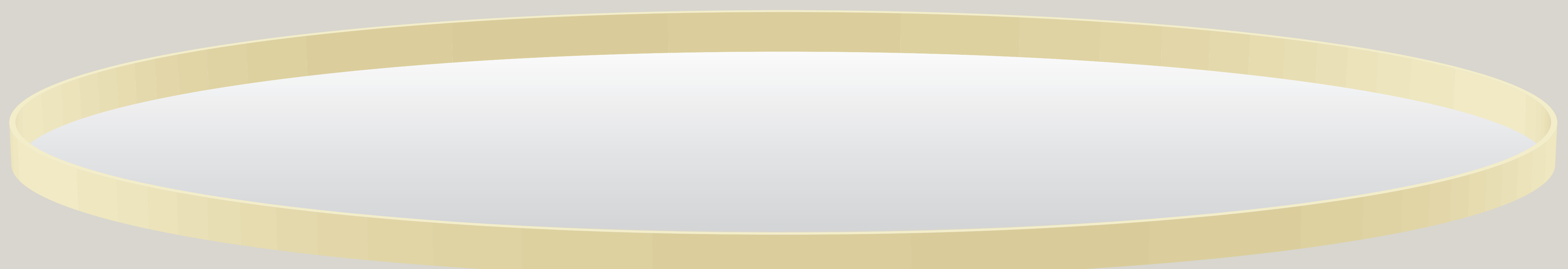
Diagramme 1: Age entre 10-17 ans: Pour des passes soulevées, utilisation d'une bande fixe qui peut être à l'intérieur d'un patinoire Nord Américaine ou Olympique ou tout simplement une ellipse d'Or, hauteur minimum 30 cm.

Top of the board no matter its height: One of many possibilities to keep the puck inside the ellipse and to avoid injuries.