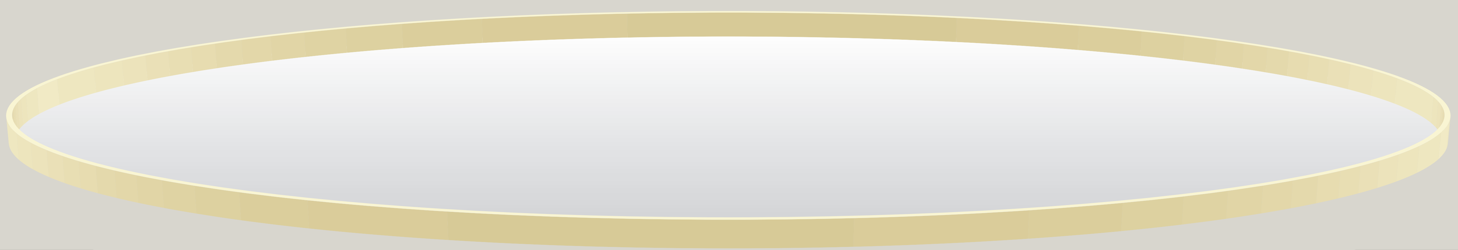
Diagram 2: The same as the one above but inside an Olympic skating rink.

Haut de la bande quelque soit sa hauteur: Une de plusieurs possibilités de garder la rondelle à l'intérieur de l'ellipse et d'éviter les blessures.